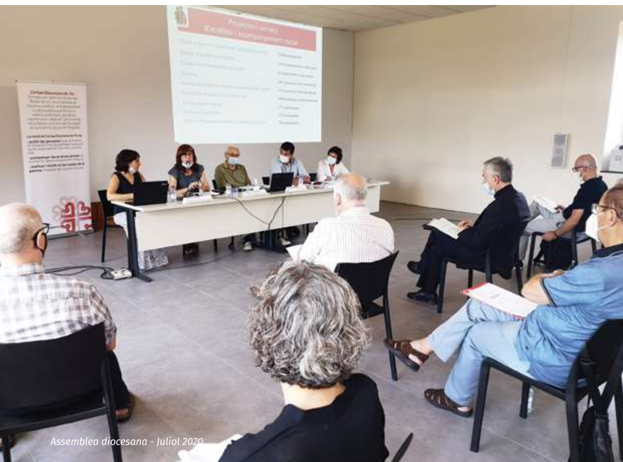
Assemblea diocesana - Juliol 2020

Vetlla pregària de Nadal en format virtual, amb més de 80 persones connectades.