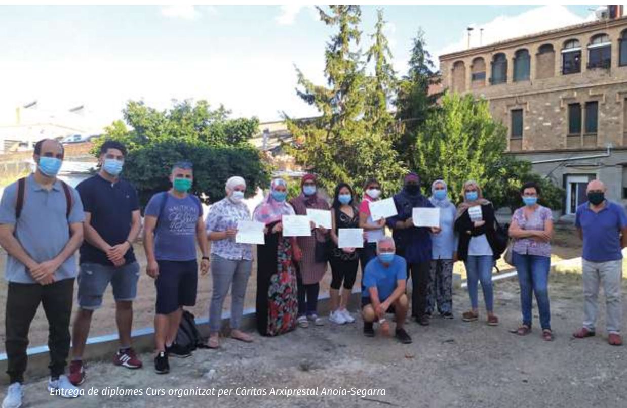
Entrega de diplomes Curs organitzat per Càritas Arxiprestal Anoia-Segarra