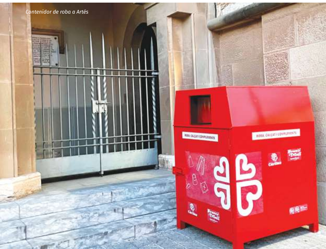
Contenedor de roba a Artés

Les Càritas de Sallent, Artés i Manresa han apostat per dignificar l'entrega social de roba facilitant vals econòmics per a la botiga de segona mà Moda -Re, ubicada a Manresa.