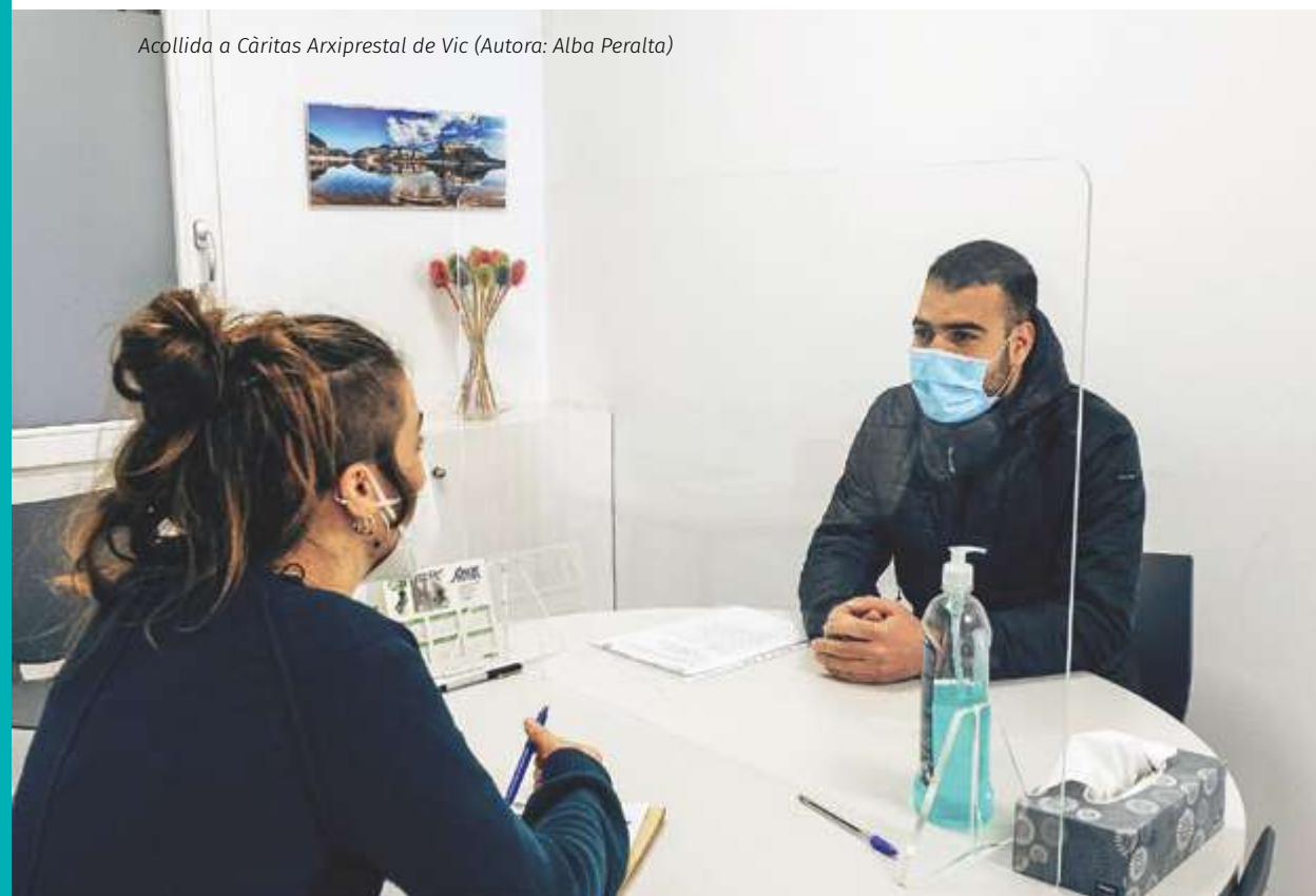
Acollida a Càritas Arxiprestal de Vic