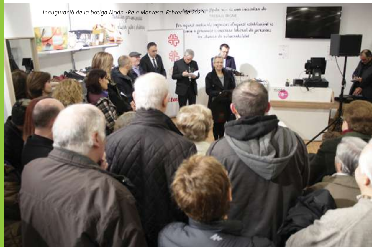
Inauguració de la botiga Moda -Re a Manresa. Febrer de 2020

Hem treballat conjuntament amb altres organismes, fundacions i associacions per acompanyar i promocionar les persones que es troben en situació de vulnerabilitat social.