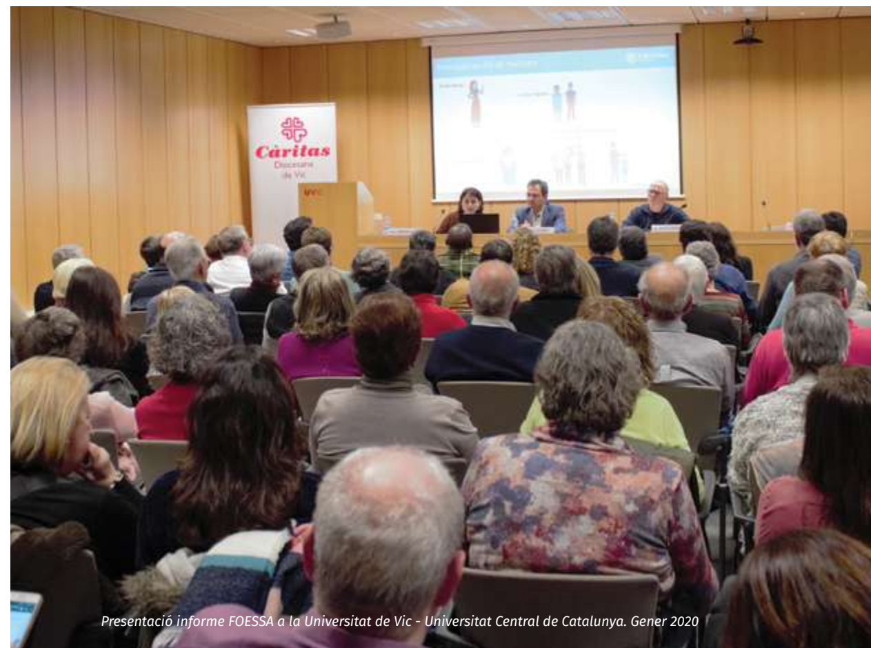
Presentació informe FOESSA a la Universitat de Vic - Universitat Central de Catalunya. Gener 2020