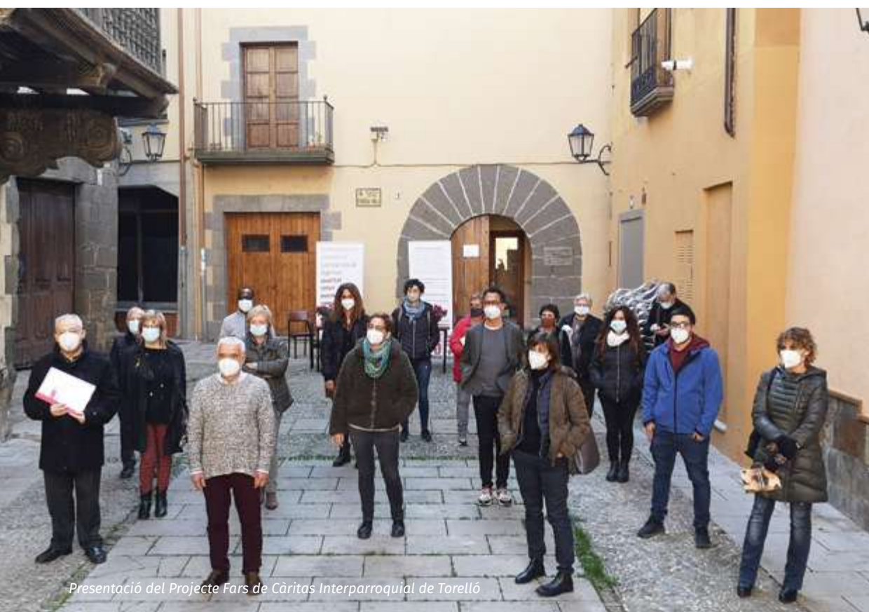
Presentació del Projecte Fars de Càritas Interparroquial de Torelló