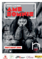
Ningú sense llar